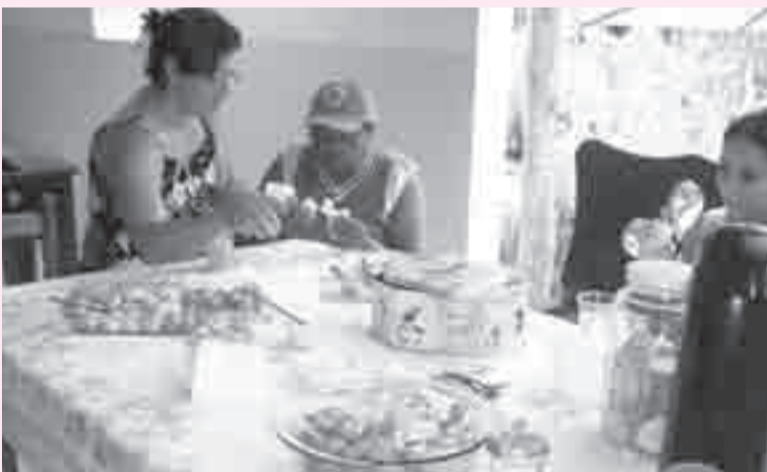
Hora do lanche. É preciso um "reforço" para participar dos debates com os companheiros e companheiras presentes.