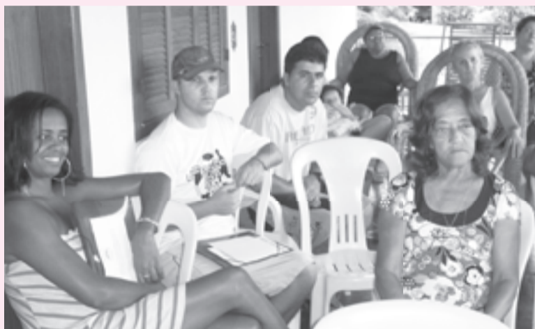
Alguns participantes, em uma das palestras. Vejam que a varanda, onde nos reunimos, se abre para todos admirarem a beleza da paisagem.